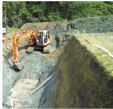
活断層トレンチ調査の様子