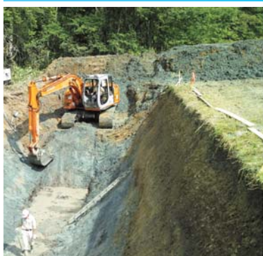
活断層トレンチ調査の様子(産総研)