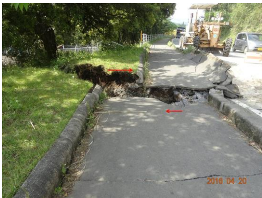
写真 1 右横ずれ変位を示す路肩（R:120cm）

大切畑ダム西方、鳥子集落の南東では、既存の布田川断層よりも南に地表地震断層が出現した（図 1）。南の山地へ上る S 字カーブの道路を切断する形で、地表地震断層が出現した。変位量は右横ずれ約 120cm、北側上がり約 10-20cm である（写真 1）。地表地震断層はさらに東へ山地内へと連続する。一方西側では、畑や道路を右方向に切断する数条の断層が認められた（写真 2）。数条をまとめて計測した畝の右横ずれ変位量は約 110cm であった。さらに西方の畑では南側隆起の変位を与えながら、山中へと連続する様子を観察した。