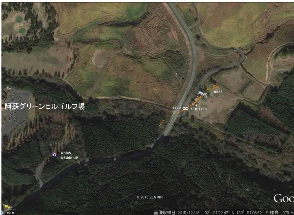
図 2 阿蘇グリーンヒルゴルフ場東方に出現した地表地震断層。県道 28 号線旧道に沿った家屋を軒並み破壊している。

一方、県道 28 号線から阿蘇グリーンヒルゴルフ場へと入る取り付け道路には、東側上がり約 70cm、右横ずれ約 75cm の低崖が出現した(写真 5)。この崖は地表地震断層に連続する可能性があるが、低崖の走向が N30°W と、布田川断層の一般走向とやや斜交すること、沢を埋土した道路が斜面下方向へ動いたと考えることもできるため、精査の必要がある。