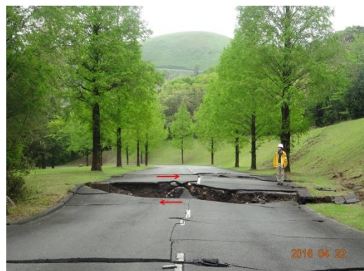
写真 5 阿蘇グリーンヒルゴルフ場取り付け道路に出現した低崖。東側隆起で右横ずれを示す。