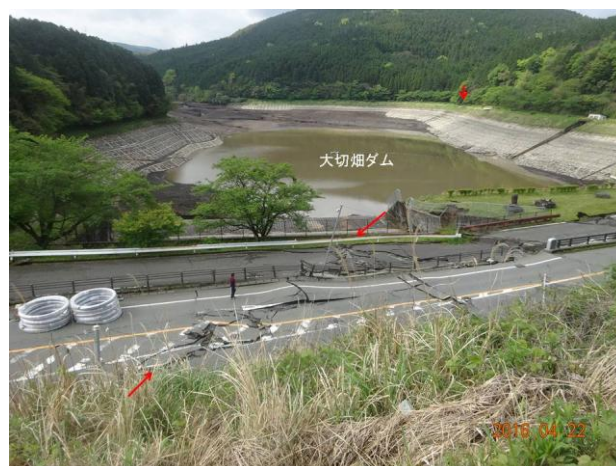
写真3 大切畑ダムの堤体を破壊しこれを横切る地表地震断層。路面やガードレールも大きな変形を受け破壊されたことが分かる。地表地震断層はダム西側の護岸も破壊し（写真奥の赤矢印付近）、さらにその右手の鞍部方向へ連続する。

大切畑ダムでは、ダム堤体と斜交しながら堤体を破壊する地表地震断層が出現した（図1）。ガードレールや路面のアスファルトに水平短縮が認められ、右横ずれ約70cmの変位が認められた（写真3）