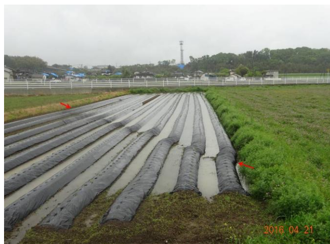
写真6 畑の畝を連続的に右方向に横ずれ変位させる地表地震断層（041地点）

南方の、矢形川の谷底平野にも地表地震断層が出現した。水田の畔や畑の畝を横切る地表地震断層では右横ずれ変位が連続的に観察されたが（写真6）、変位量は最大約45cm、南西方向へ減少し、滝川の段丘上では路肩を10cm変位させている（045地点）。同地点のすぐ北東側では畑の畝で東北大学のグループによって変位が報告されている。これら地点の南西では緑川まで踏査を行ったが、地表地震断層を認めることはできなかった。本地点付近が今回一連の地震で出現した地表地震断層の南端を示す可能性がある。