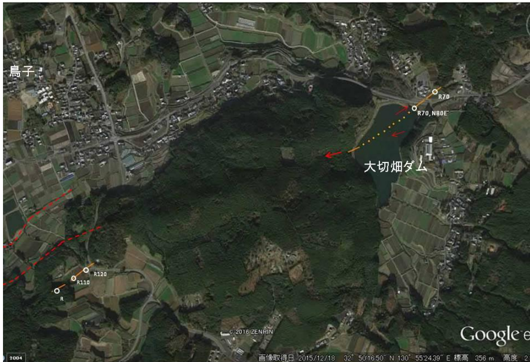
図1 大切畑ダム周辺に出現した地表地震断層（オレンジ線）。鳥子集落南方では、既知の断層線（赤破線）よりも南側に出現した。地表地震断層は大切畑ダムの堤体を斜めに横切り、ダム西側の護岸を変位させる。さらに西の鞍部へ連続する可能性が高い。

大切畑ダムでは、ダム堤体と斜交しながら堤体を破壊する地表地震断層が出現した（図1）。ガードレールや路面のアスファルトに水平短縮が認められ、右横ずれ約70cmの変位が認められた（写真3）