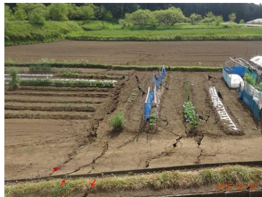
写真 2 西側畑へ複数の剪断帯として連続する。画面中央少し上を左右に横切る畝は、右ずれ 110cm。