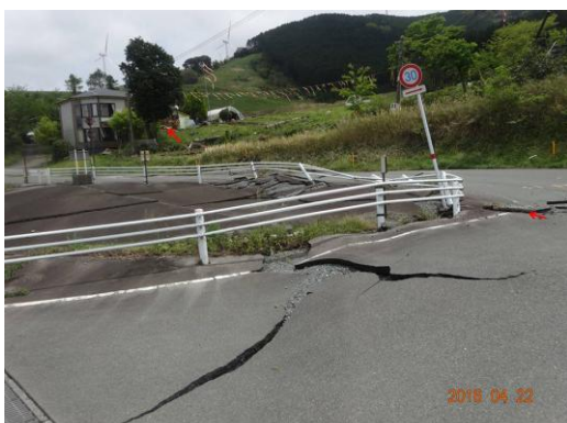
写真 4 傾いた標識から左奥の家屋方向へ連続する地表地震断層。標識の左にはバルジ状の高まりがみられる。